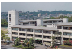
新校舎計画につき現状建物掲載