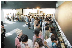
宮本輝ミュージアム