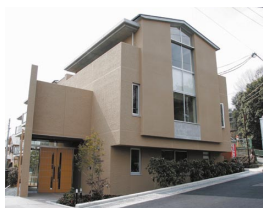
「心のクリニック」が開設されている地域支援心理研究センター