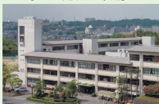
▲高校棟(教室・選択教室等) (新校舎計画中につき現状建物掲載)