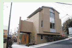
▲地域支援心理研究センター