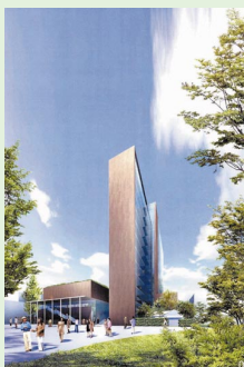
▲中央棟新築及び6号館新築 (完成予定図)