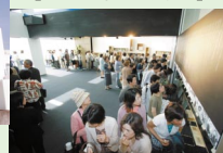
▲宮本輝ミュージアム